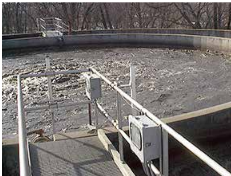
CJ-1020 est un produit d'étanchéité couramment utilisé pour les joints de construction de sol à mur sur des réservoirs d'eau

L'Hydrotite est conçu pour une utilisation dans des environnements d'eau douce avec de petites quantités de contaminants. Des essais adaptés au site spécifique sont nécessaires dans les zones exposées à des produits chimiques concentrés, des fluides de traitement ou des saumures.